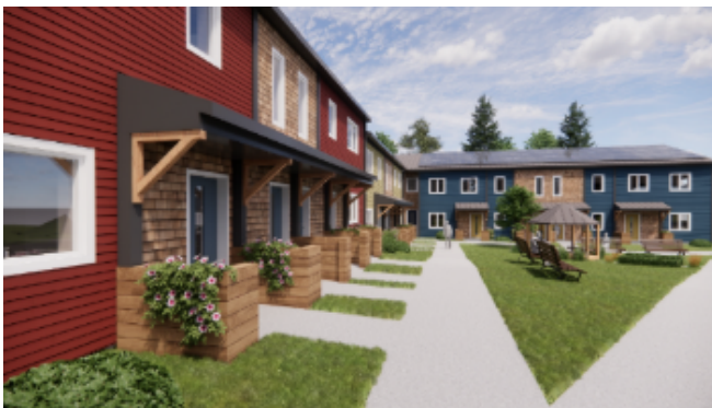
Rendu des solutions de conception passive Queens Neighbourhood Co-operative Housing Liverpool, Nouvelle-Écosse

La QNCH a bénéficié du soutien et du financement du PDCH. Les opinions exprimées ici sont les points de vue personnels de l'auteur, et la SCHL n'assume aucune responsabilité à cet égard.